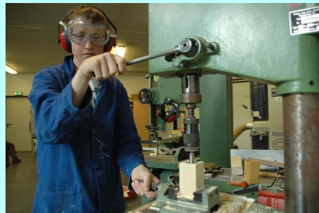
Arbeit an der Standbohrmaschine

Beim Einsatz verschiedener Maschinen ist Sicherheit und Genauigkeit gefragt. Die Schülerinnen und Schüler stellen einfache Holzprodukte her, zum Beispiel Kerzenständer, Futterhäuschen oder CD-Halter