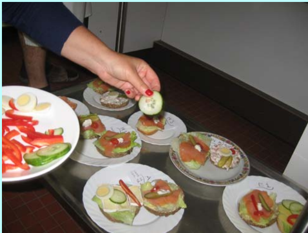
Wir belegen Brötchen

Im Schüler-Bistro lernen die Schülerinnen und Schüler alle Arbeiten in der Küche kennen.