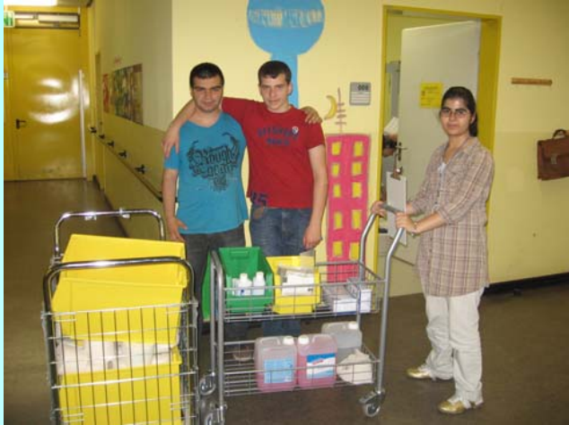
Wir arbeiten im Team

Im Hausmeister-Service versorgen die Schülerinnen und Schüler die Waschräume mit Toilettenpapier, Papierhandtüchern und Seife.