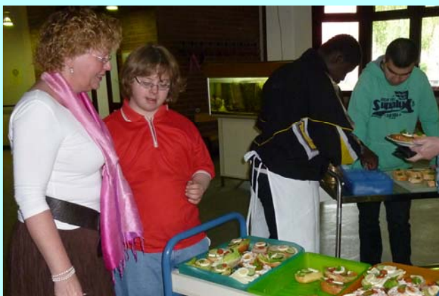
Verkauf in der Schule